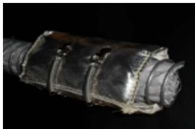
Protezione termica 400°C su tubo flessibile