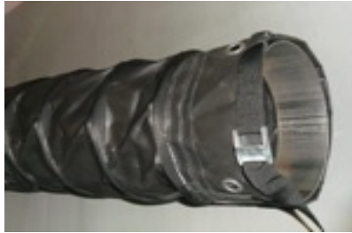
Ventilation hose with button-hole and fixing stripeband

Tubi Flessibili is new company specialized into production and sales of flexible industrial hoses for special applications. Thanks to our 20 years experience into this sector, we have been in contact with lot of different customer looking to receive unique, customized and specialized solutions to their problems. These experiences allowed us to study, projects and produce lot of solutions "ad hoc" for every single customer. Today we are able to realize new items below showed. Please be free to contact us for any kind of information you may need.