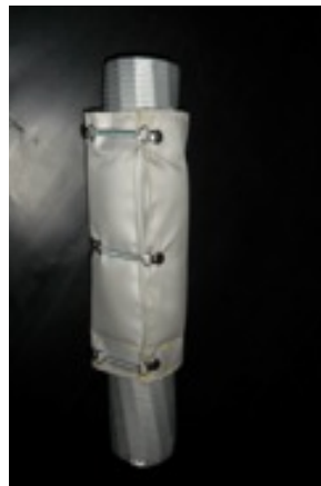
Metal hose thermal protection up to +400°C