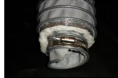
Insulated high temperature hose for energy recovery