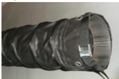
Tubo Ventilazione fornito con asole e cinghia di fissaggio

La Tubi Flessibili è una società artigiana specializzata nella produzione e commercializzazione di tubi flessibili industriali per applicazioni speciali. Grazie alla nostra esperienza pluriennale nel settore siamo entrati in contatto con numerose aziende alla ricerca di soluzioni singole, uniche, personalizzate. Queste esperienze ci hanno permesso di studiare, progettare e realizzare molteplici soluzioni "ad hoc" per ogni singolo cliente.