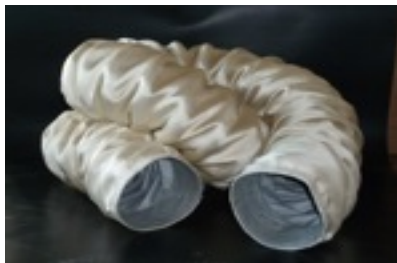
Tubo aspirazione aria calda (150°C) con protezione esterna antiscintille