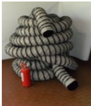
Tubo aspirazione vapori di benzina avio d.int 203x50 metri in pezzo unico (fornito a compagnia aerea c/o aeroporto)