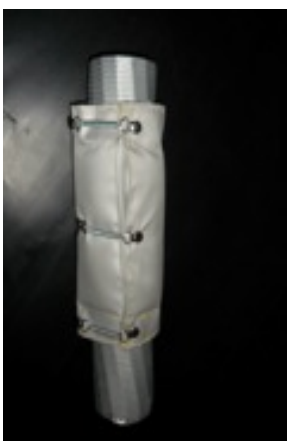
Protezione termica 400°C su tubo metallico