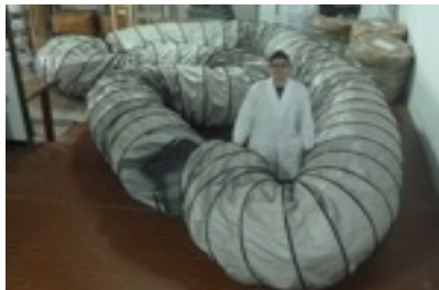
Ventilation hose id 800 x 25 meters long single length