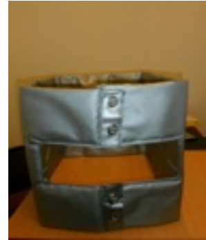
Thermal protection for vapour sistem