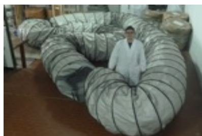
Tubo Ventilazione d.int. 800 x 25 metri in pezzo unico