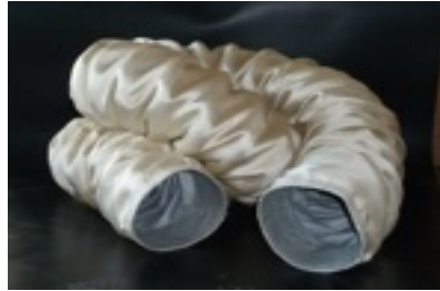
Hot air suction hose (+150°C) with external sparks (silica cover)