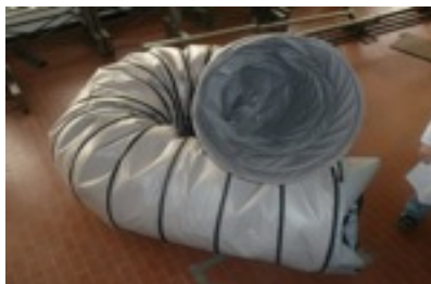
Tubo Ventilazione coibentato d.int. 700 x 6 metri in pezzo unico