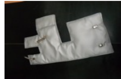
Bespoken thermal protection for turbocharger application

Tubi Flessibili srl - Via Frascarolo, 60/B - 15046 S.Salvatore M.to (AL)