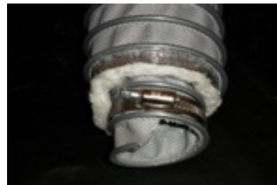
Tubo coibentato per recupero energia