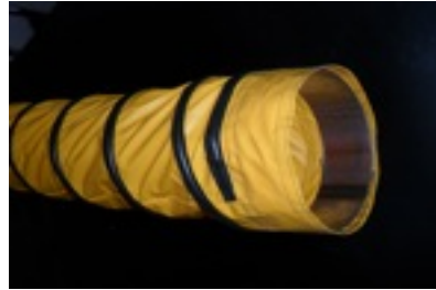
Ventilation hose with external abrasion protection stripe