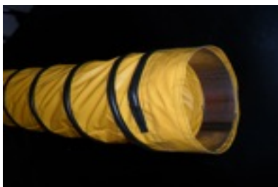
Tubo Ventilazione fornito con profilo per protezione antiabrasiva