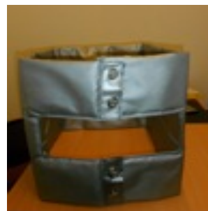
Protezione termica per batteria vapore