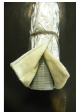
Protezione termica in fibra silice su tubo metallico